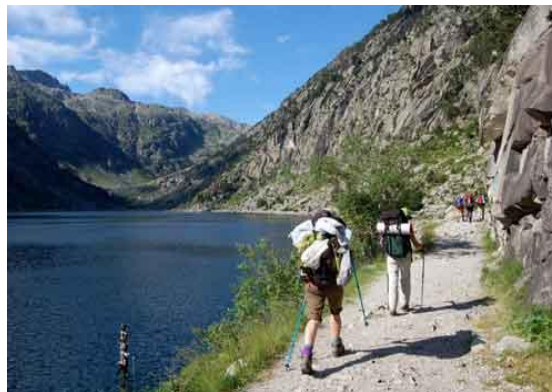
Valle de Boi, Pirineo Catalán