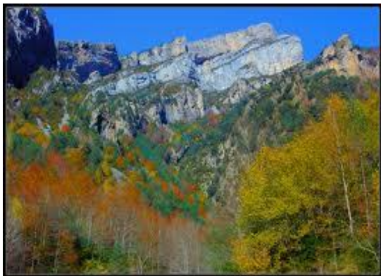
Canón de Añisclo, Pirineo de Huesca