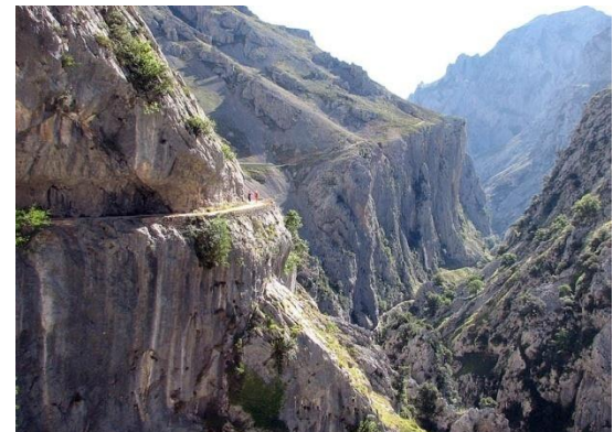
Ruta del Cares, Picos de Europa